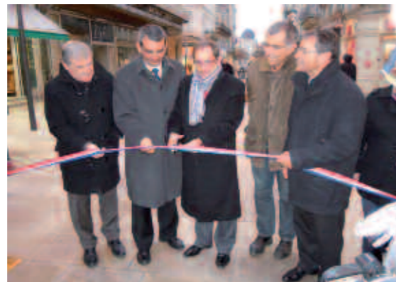
Inauguration de la rue de la République à Périgueux, le 26 novembre. Aux côtés du maire Michel Moyrand et du sénateur Claude Bérêt-Debat.

Au cours des quatre réunions de bilan de mandat qui ont eu lieu dans la Vallée, j'ai eu le plaisir de venir à la rencontre de mes concitoyens et de pouvoir répondre à leurs nombreuses questions.