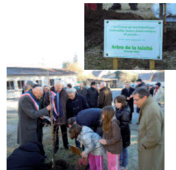
Plantation d'un arbre de la laïcité, le 11 décembre à Annesse et Beaulieu.