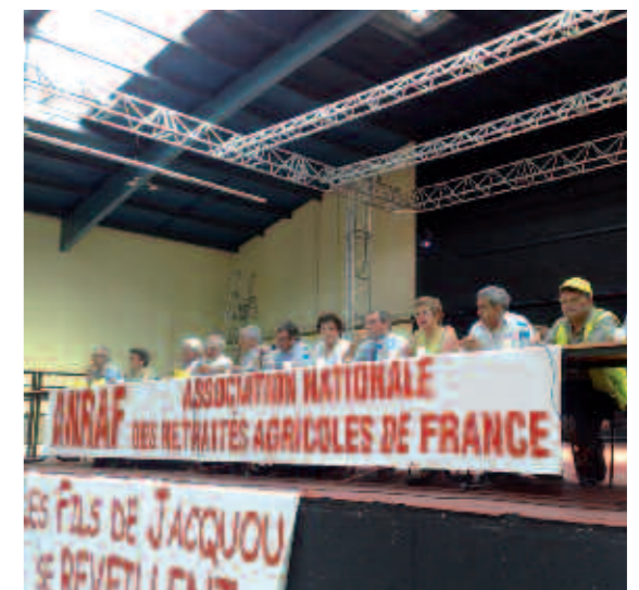
Congrès national des retraités agricoles, le 20 août à Bergerac