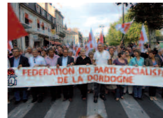
Manifestation pour la sauvegarde des retraites, le 23 septembre à Périgueux.