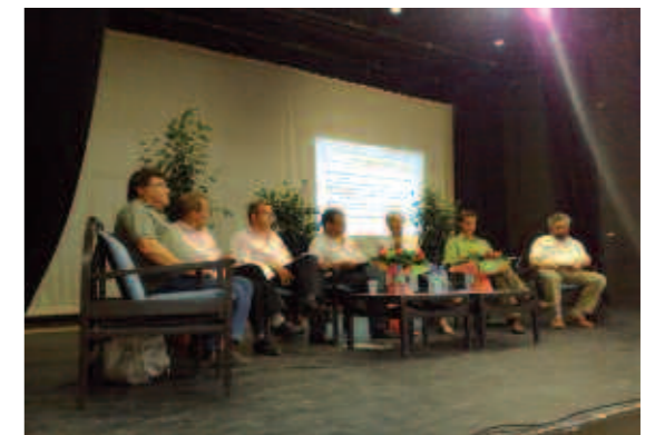
Table ronde aux rencontres d'été du Pôle Ecologique du PS, le 27 août en Gironde.