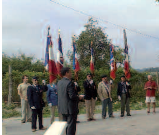
Cérémonie commémorative à Saint-Germain du Salembre (Espinasse).