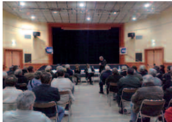
Réunion publique à Montpon le 29 novembre.

Je continue de soutenir le monde combattant et les associations pour une égalité de traitement entre les générations du feu. Je salue et soutiens leur travail inlassable de passeurs de mémoire et de défenseurs des libertés.